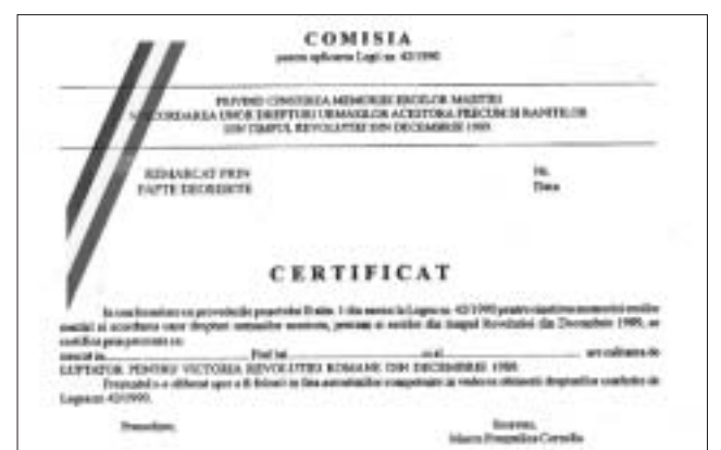
Documente falsificate de gruparea Ispas