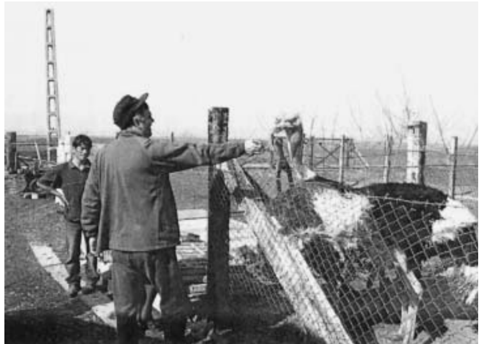
Ferma de struți a domnului președinte de sindicat