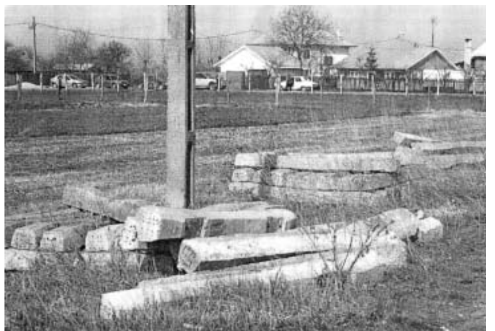
Casa lui Molea din comuna Valea Cireșului