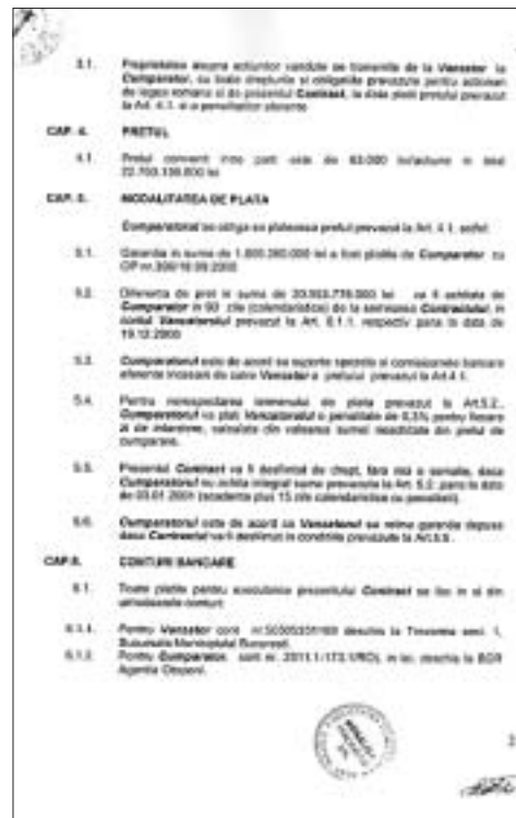
Așa poți cumpăra o societate comercială fără să te coste nimic