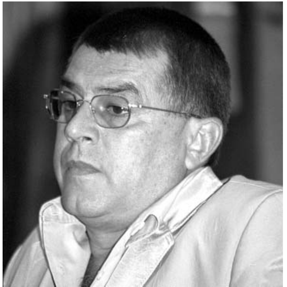
Președintele Comisiei Parlamentare de Control al SRI

Fondurile bugetare alocate SRI au fost gestionate corect, au stabilit parlamentarii.