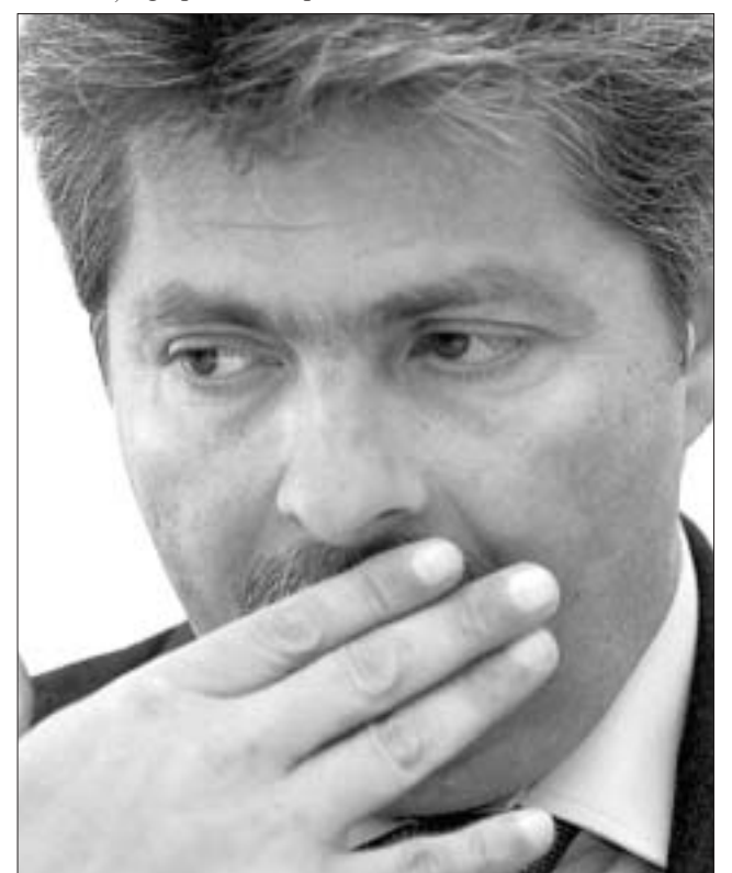
Sorin Ovidiu Vântu