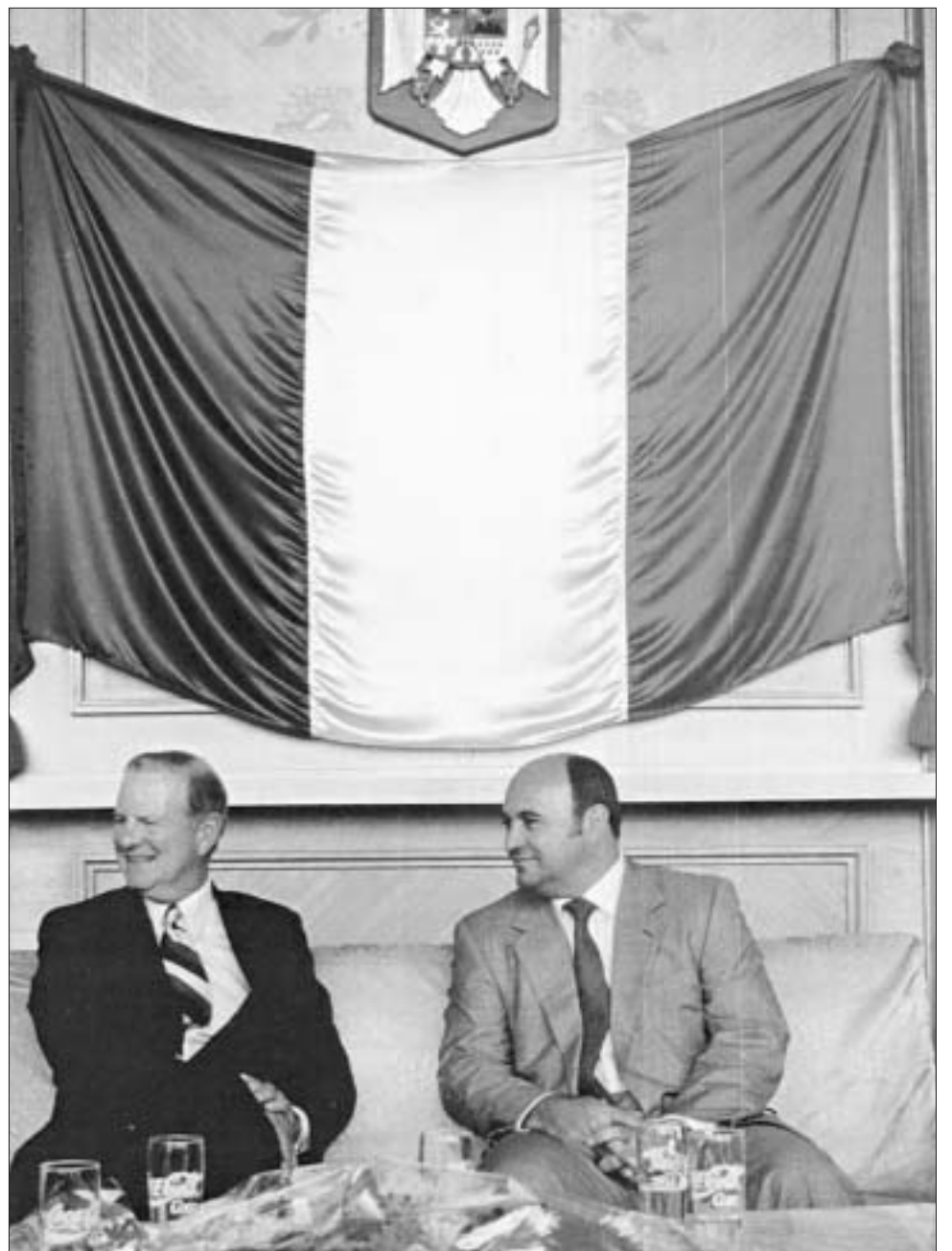
James Baker, fost secretar de stat al SUA, invitat personal de Sever Mureșan

Astfel de acțiuni de influențare pozitivă sunt specifice tuturor țărilor aflate în tranziție și dacă sunt bine gestionate pot avea efecte benefice mult mai mari decât cele obținute de diplomația oficială.