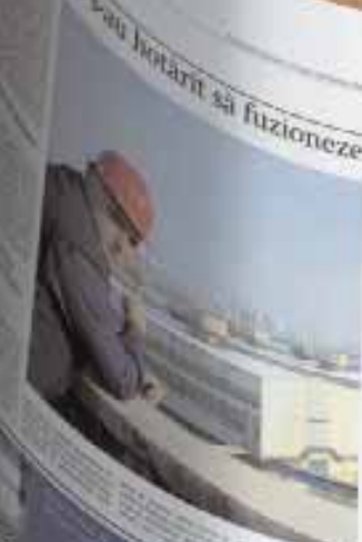
Companii... hotarari sa fuzioneze