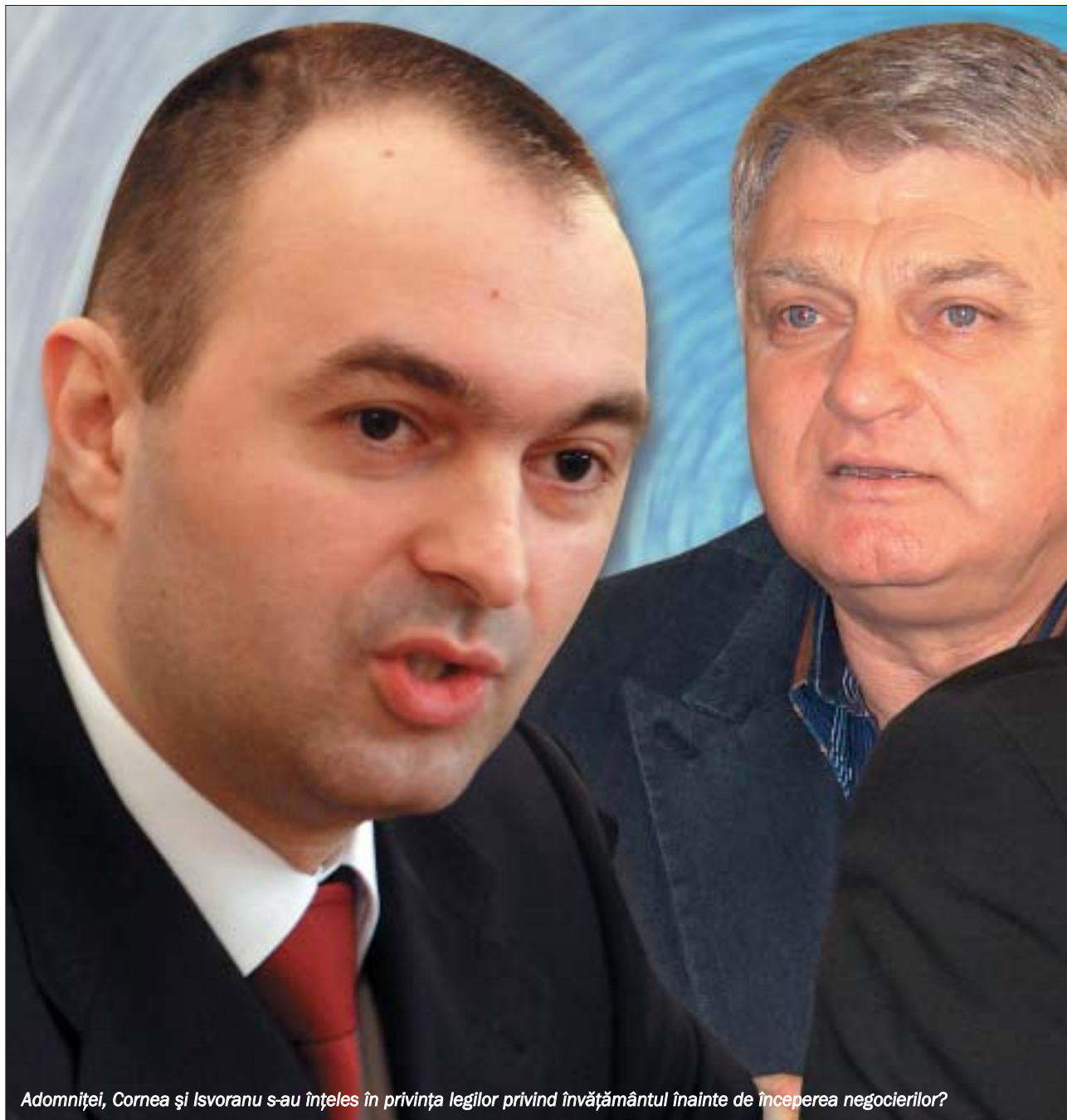
Adomniței, Cornea și Isvoranu s-au înțeles în privința legilor privind învățământul înainte de începerea negocierilor?

Mai mult ca sigur că întrebările vor rămâne fără răspuns, însă rezultatele acestor așa-zise negocieri vor afecta grav învățământul dacă vor trece de Parlament.