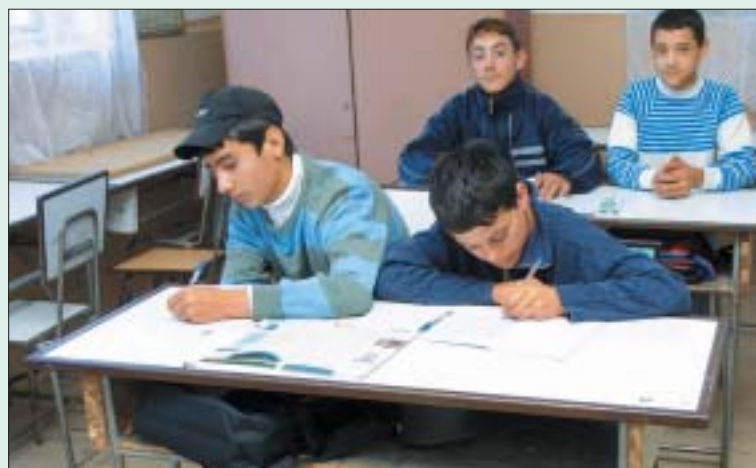
Facem schimbări de suprafață fără să ținem cont de stadiul actual al învățământului

8. Funcțiile de conducere de la nivelul unităților de învățământ. Actualele proiecte prevăd pentru fiecare unitate de învățământ, indiferent de numărul de copii/elevi funcțiile de director, director adjunct și director educativ. Funcția de director adjunct și director educativ va trebui normată, după caz, în funcție de numărul de grupe/clase de complexitatea unității și a activităților desfășurate. Nu este cazul să numim trei directori într-o unitate de învățământ fie ea și cu personalitate juridică care cuprinde 200 de copii/elevi. Numirea directorilor unităților de