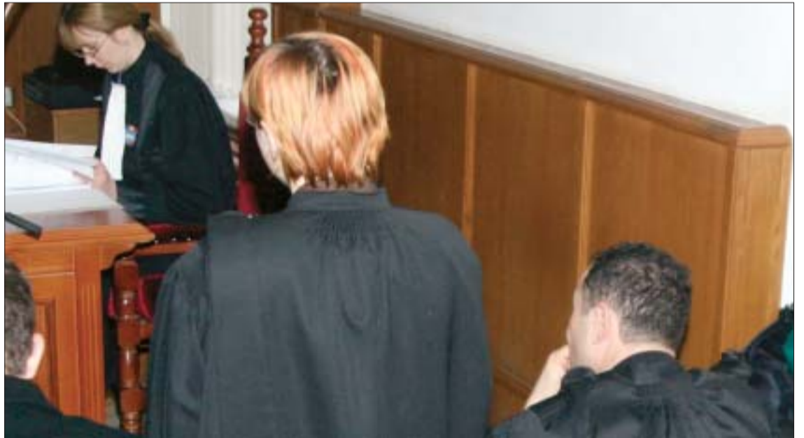
Sindicatul este obligat să deschidă sute de procese din cauza nerespectării legilor

Federația Educației Naționale a început demersurile pentru acordarea salariului minim de 880 de lei pentru salariații care sunt încadrați pe funcții pentru care se cer studii superioare de lungă durată, prin adresa nr. 195/617/15.06.2007 am sesizat Consiliul Național pentru Combaterea Discriminării. În urma deliberării și administrării de acte, CNCd a decis prin Hotărârea nr. 291 din 27.09.2007 că personalul din învățământ este discriminat prin neacordarea salariului minim de 880 lei garantat prin Contractul de Muncă Unic la Nivel Național 2007-2010. În paralel, am deschis proces la Curtea de Apel și la Tribunalul București pentru respectarea prevederilor Contractului Unic. De asemenea, organizațiile teritoriale au deschis procese la nivel județean. La 2 noiembrie, Curtea de Apel, printr-o sentință definitivă, obligă MECT și Guvernul României să identifice sursele pentru acordarea salariului