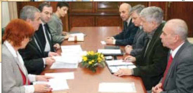
Până în acest moment negocierile nici nu au început