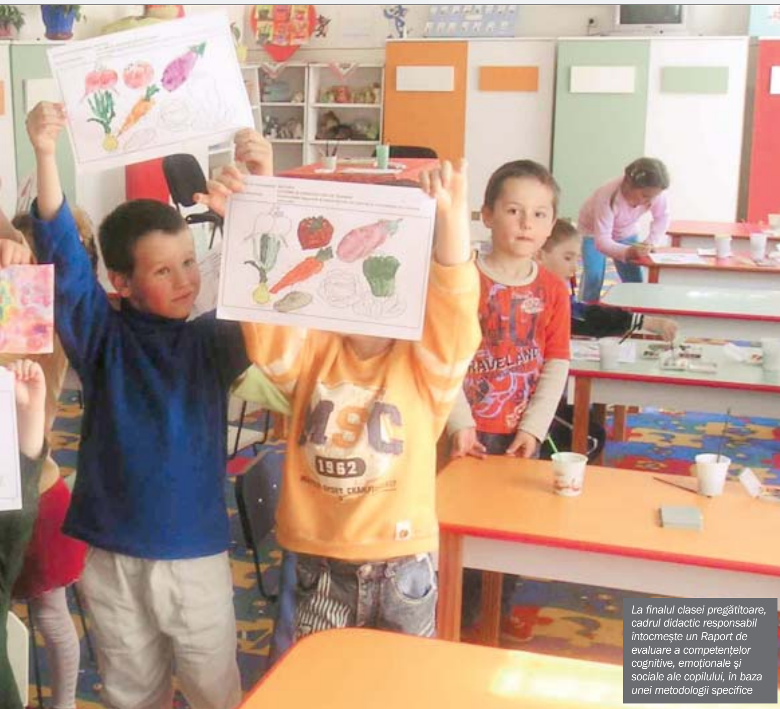
La finalul clasei pregătitoare, cadrul didactic responsabil întocmește un Raport de evaluare a competențelor cognitive, emoționale și sociale ale copilului, în baza unei metodologii specifice

Reforma curriculară implică, automat, o reformă a modului în care sunt evaluați elevii. O metodologie de evaluare necompatibilă cu noul curriculum va crea unul paralel. Elevii vor învăța mai degrabă ceea ce va fi evaluat decât ceea ce este stabilit în curriculum. Strategia susține o evaluare congruentă cu ciclurile școlare, centrată pe competențe, care să ofere feedback real elevilor și care să stea la baza planurilor individuale de învățare.