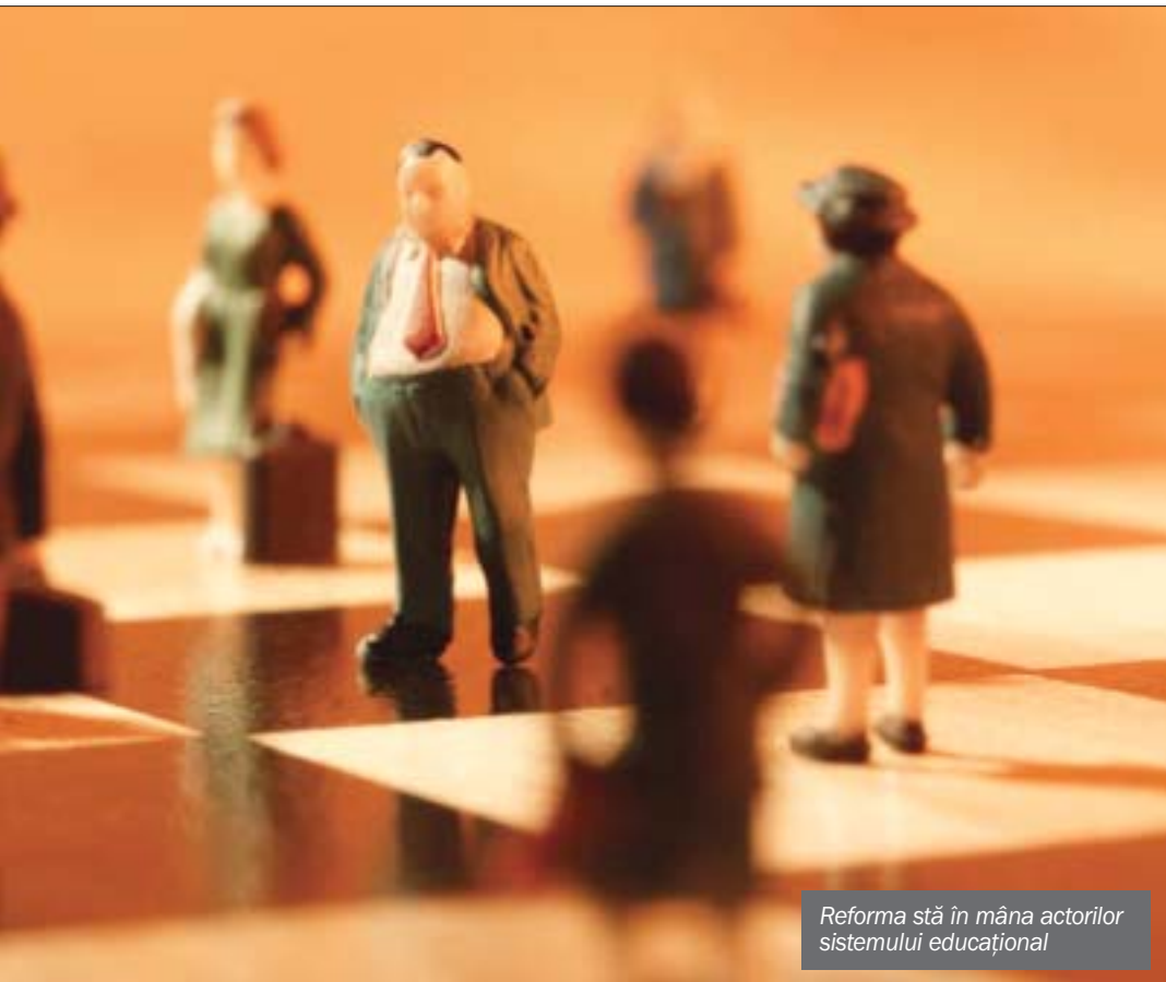
Reforma stă în mâna actorilor sistemului educațional