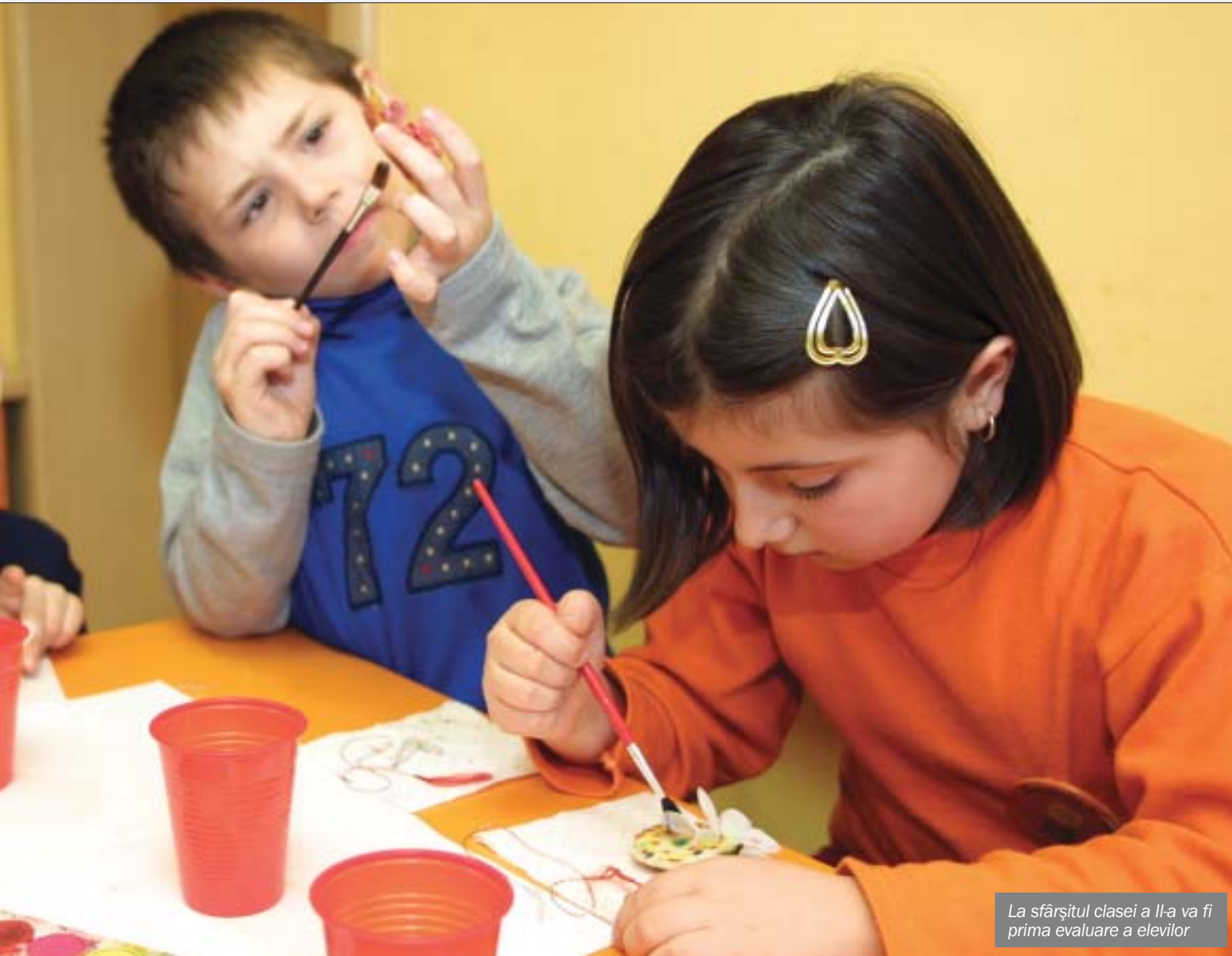
La sfârșitul clasei a II-a va fi prima evaluare a elevilor

Managementul unităților de învățământ devine o activitate tot mai complexă. Ea este o ocupație în sine, nu o simplă funcție pe care o îndeplinește, temporar, după orele la clasă, un cadru didactic. Ea trebuie complet depolitizată. Vor fi elaborate standardele ocupaționale pentru toate pozițiile manageriale din sistemul de învățământ, de la director de școală, până la cea de director general din minister. În baza standardelor profesionale, vor fi realizate formarea continuă și inițială pentru managementul unităților de învățământ. Se va înființa un Centru Național de Resurse, accesibil on-line, care