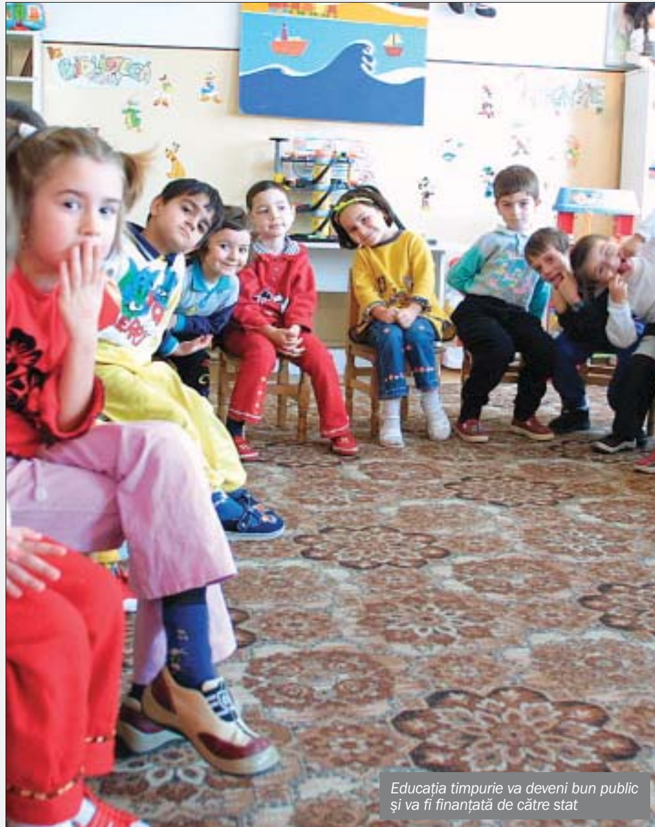
Educația timpurie va deveni bun public și va fi finanțată de către stat

Rezultatele obținute de către elevi se vor exprima în puncte (componentele a și b) sau calificative (componentele c, d), care să reflecte nivelul atins în dobândirea competențelor cheie de către fiecare elev în parte. Nu se va opera cu nicio grupare binară a rezultatelor de tipul „admis-respins”. Detaliile evaluării naționale de la finalul învățământului obligatoriu vor face obiectul unei metodologii specifice.