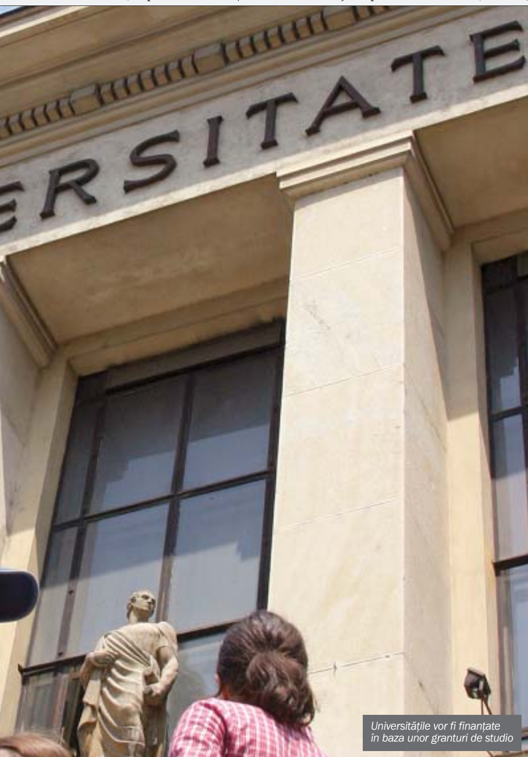
Universitățile vor fi finanțate în baza unor granturi de studio

Asumată de guvern, implementată ca un tot unitar și monitorizată riguros, strategia propusă ne maximizează șansele de a atinge obiectivele pe care cu toții le dorim. ■